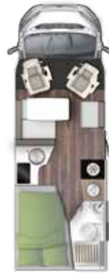
T 649 SB