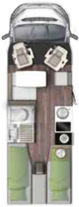
T 699 EB