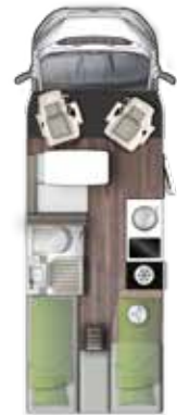
T 659 EB