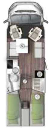
T 745 EF