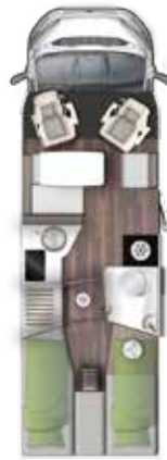
T 745 EB