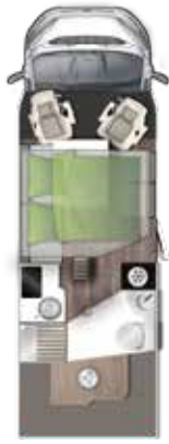
T 699 LF