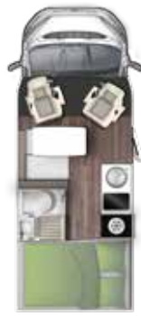
T 599 HB